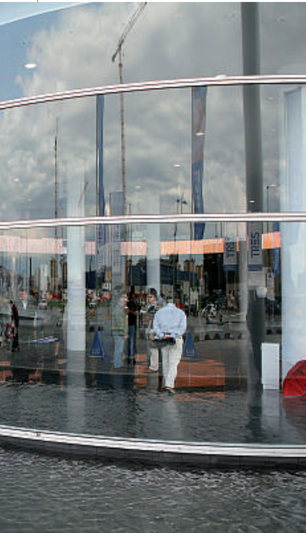
Neue Möglichkeiten: Ab 2013 wird der Mobile World Congress auf dem Gran-Via-Gelände stattfinden.

fung mobiler Lösungen, Geschäfte und Gaststätten. Letzteres wendet sich an das allgemeine Publikum und bietet eine Fülle von Aktivitäten wie Sportveranstaltungen, Musik- und Kunstfestivals, Filmpreise, Anwendungen, Technologiemesen und mehr. Ein neues Projekt wird die BSN Mobile Summer Week sein, eine Anwendermesse mit Konzerten und Veranstaltungen, die mit Sport und Kultur verknüpft